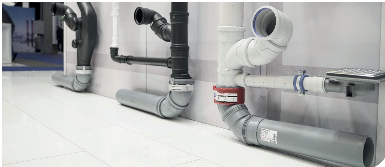
Eksempel på Mix og Match løsning.