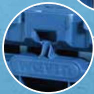
Sideplader hængslet på basisenhed