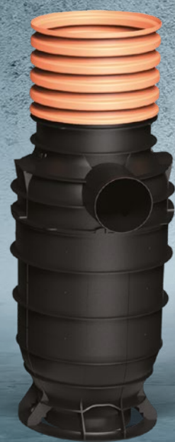
Uliční vpusť DN 315 s filtrem Součástí je sifon a 360° filtr Objem usazovacího prostoru: 70 litrů Průměr odtoku: DN 160 Materiál: polypropylen Kód: IF000900W