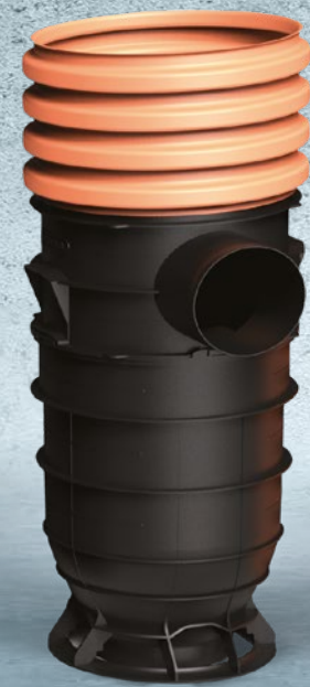
Uliční vpusť DN 425 s filtrem Součástí je sifon a 360° filtr Objem usazovacího prostoru: 70 litrů Průměr odtoku: DN 200 Materiál: polypropylen Kód: IF000910W