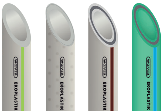
Ekoplastik EVO PP-RCT