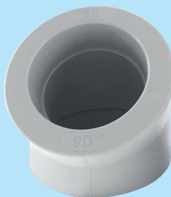
Koleno 45°, 90 mm, PPR