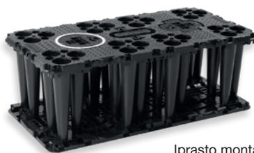
Įprasto montavimo variantas