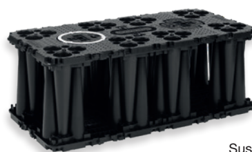
Sustiprinto montavimo variantas

* Bendra informacija montuojant vieno aukšto rezervuarą virš gruntinio vandens lygio. Naudojant daugiaaukščio rezervuaro sprendinį taikymo sritis gali būti ribojama. Wavin visada rekomenduoja ne mažesni kaip 0,3 metro dengčio sluoksnio storį. Dėl konkrečių projektų konsultuokitės su Wavin.