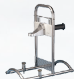
Borerigg til sadelgrenrør 3100711 Passer alle dimensjoner