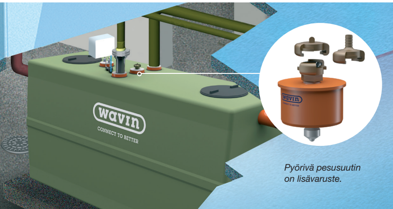
Pyörivä pesusuutin on lisävaruste.