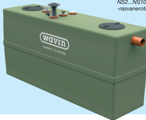
EuroREK SL GRP NS2...NS10 -rasvanerotin