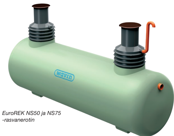
EuroREK NS50 ja NS75 -rasvanerotin