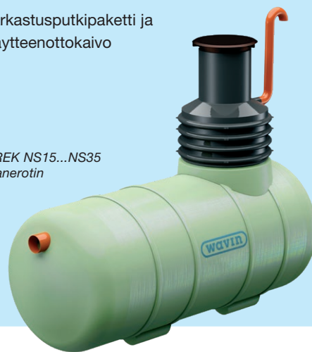
EuroREK NS15...NS35 -rasvanerotin